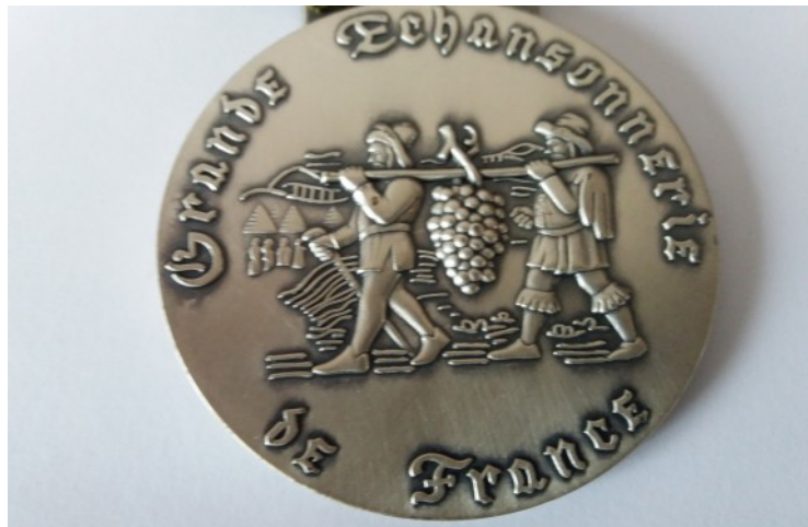
Confrerie des Echansons Ligériens