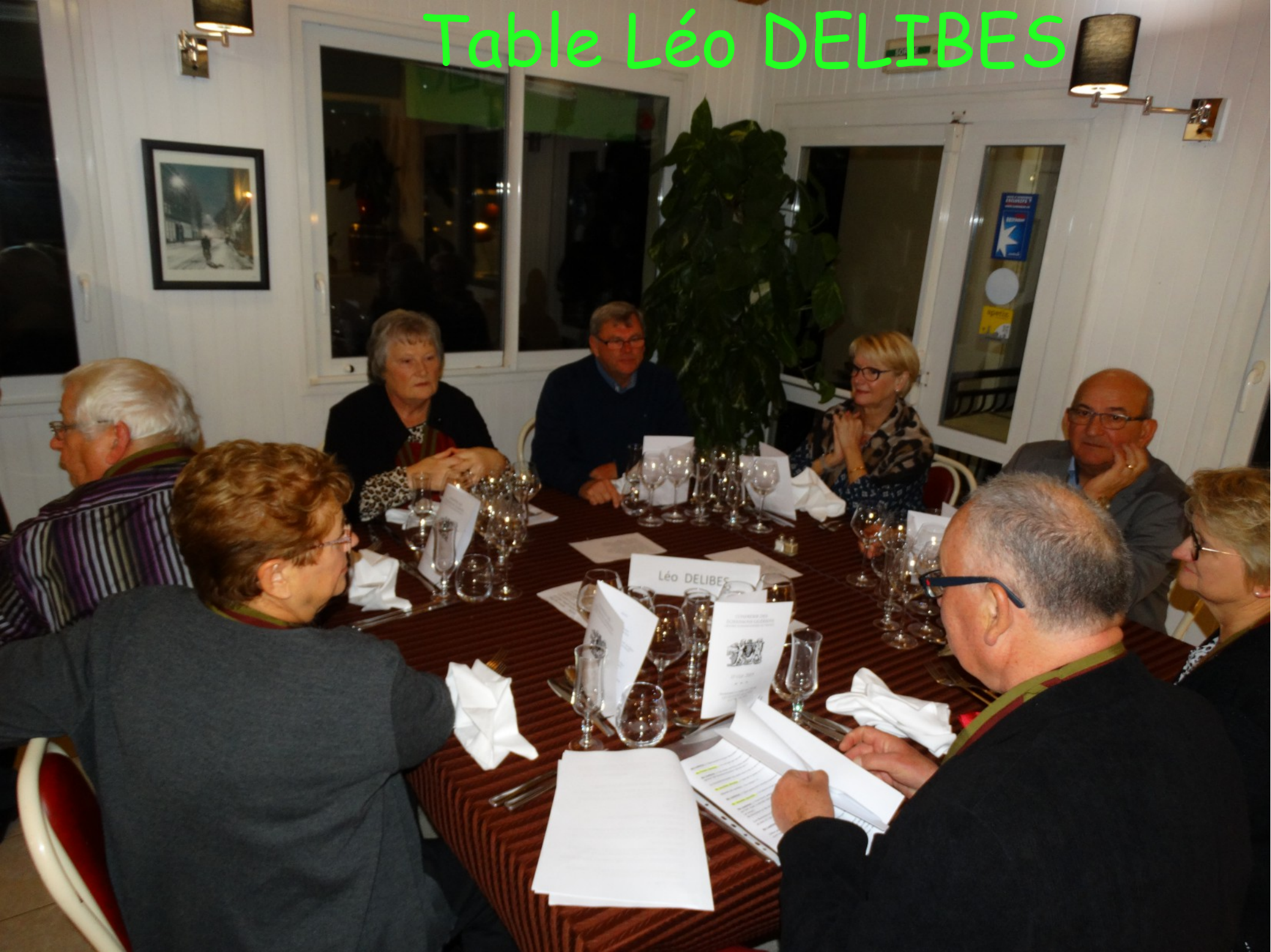
Table Léo DELIBES