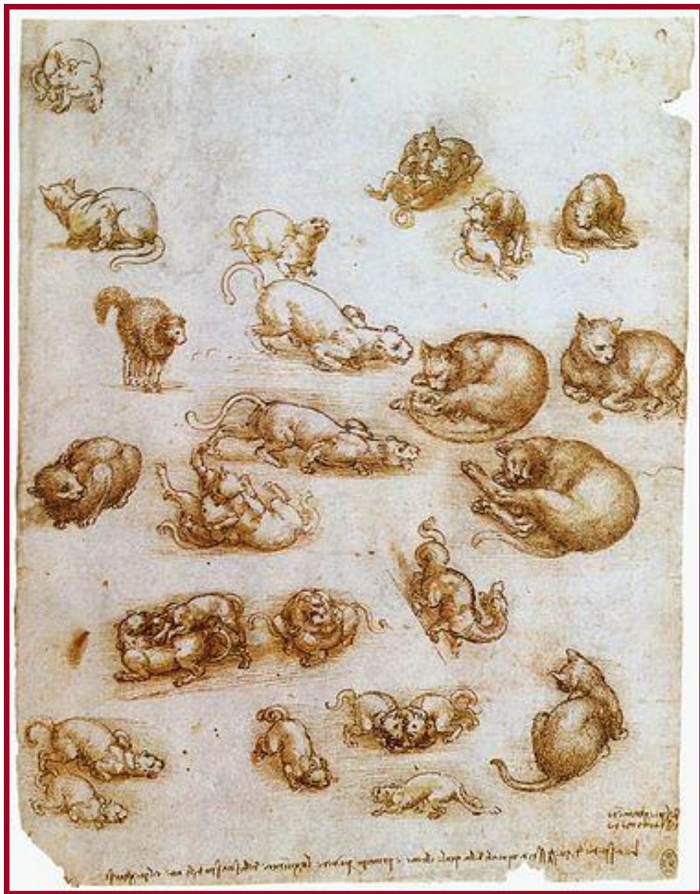
« Etude du mouvement des chats » (1517)