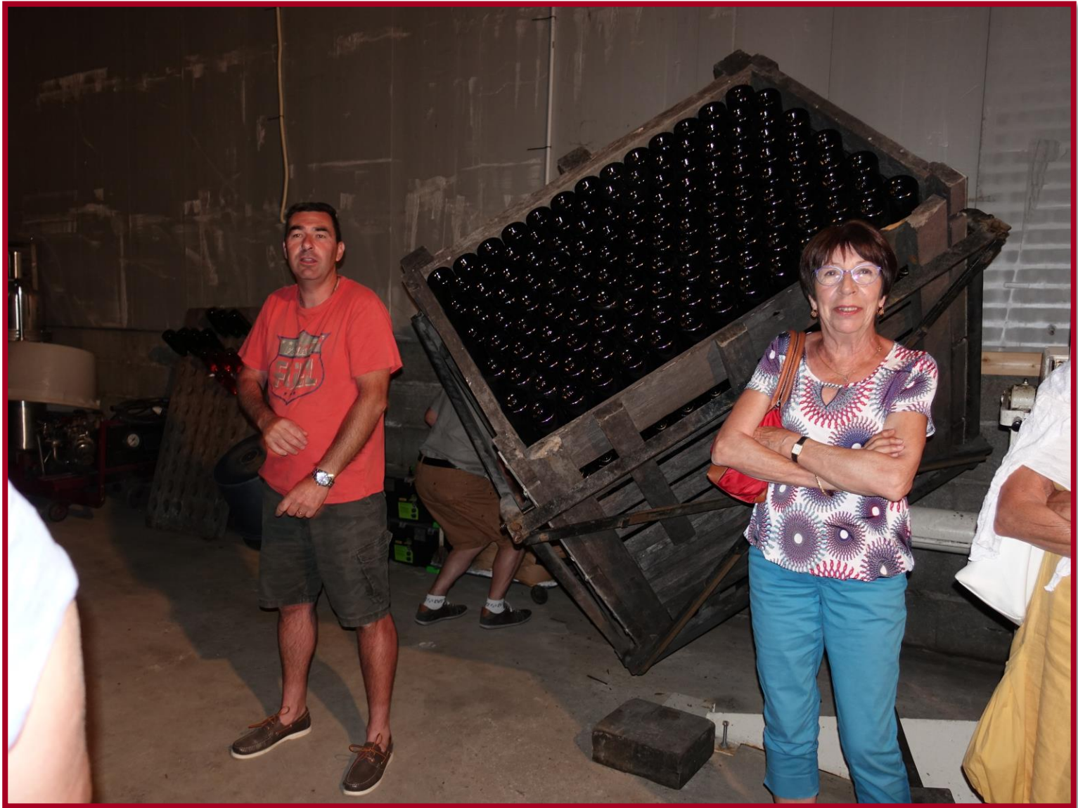
Après les vignes, le chai !