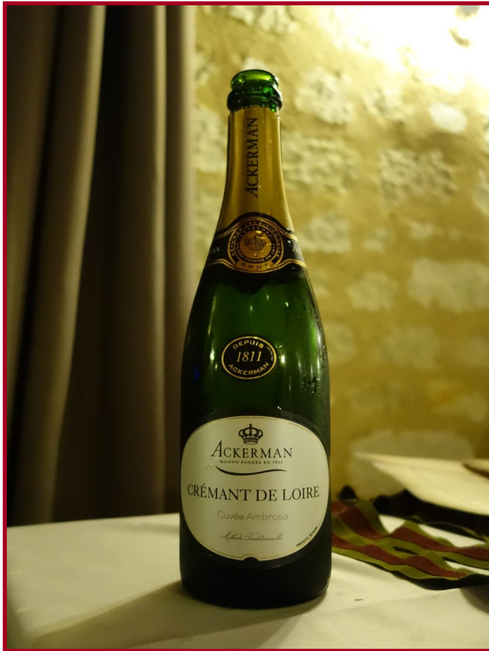
Crémant de Loire Royal Blanc brut Ackerman