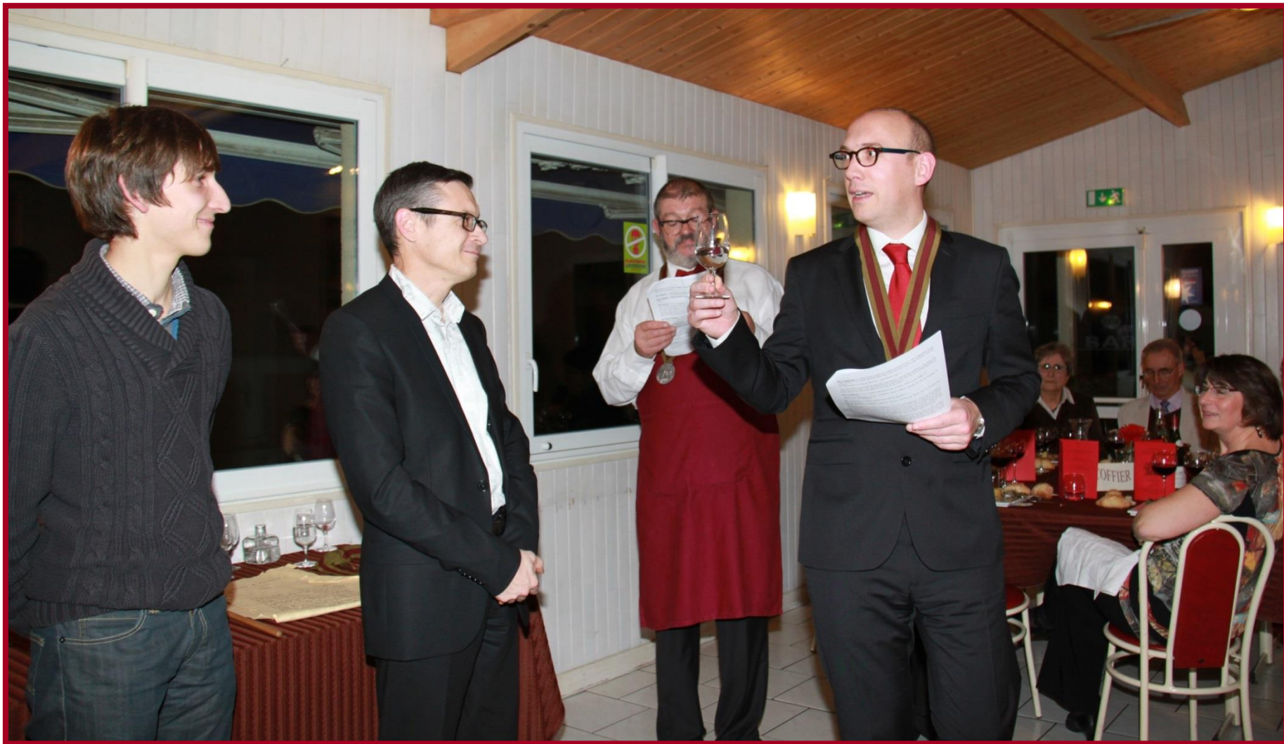
Test du vinaigre...